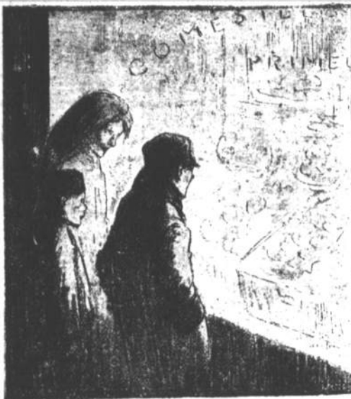
Os condemnados á eterna fome pelo inferno da actual sociedade.