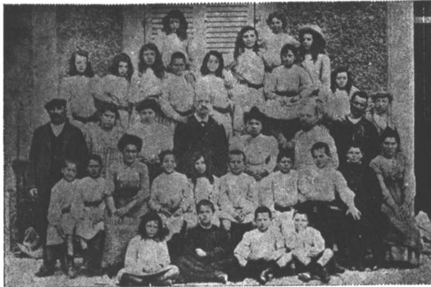
Fundada em outubro de 1905, por Sebastião Faure, em Rambouillet (Seine et Oise), França.

do virtuoso phylanthropo, appareceu uma manlhã balouçando-se em frente della, á maneira dum supplemento, o corpo do malfetor justicado, exposto pelas autoridades á publica vindicta.